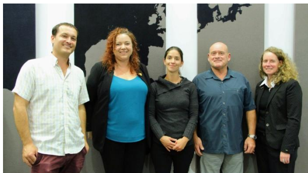
Panel : Remplacer la nature