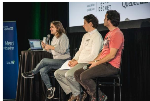
Panel : Glyphosate au festival 0 déchets