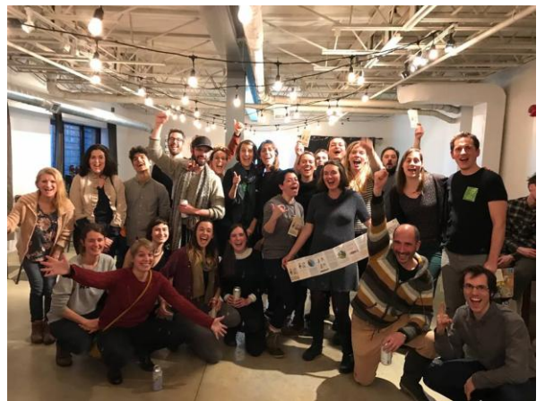
Soirée de lancement : Membres et partenaires heureux de ce lancement